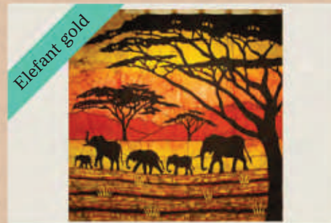
Wandbehang 1,50 x 1,35 m mit Schlaufen (Baumwolle)